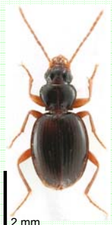
2 mm Trechus bonvouloiri Pandellé, 1867