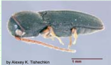
by Alexey K. Tshachkin Rhagomicrus bonvouloiri Horn, 1886 - Eucnemidae

Durant l'été, la maison de la rue de l'Université est le rendez-vous des entomologistes du monde entier. Les parents d'Henri de Bonvouloir accueillent, avec bonne grâce, les amis de leur fils unique (Brisout de Barneville, le Docteur Grenier...).