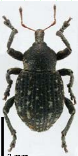
3 mm Donus bonvouloiri Capiomont, 1867