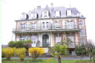
La maison familiale à Bagnères

Avec eux, il explore chaque année les grottes des Hautes Pyrénées et de l'Ariège ; il est parmi les premiers à découvrir la faune hypogée qui habite sur les parois humides de ces cavités.